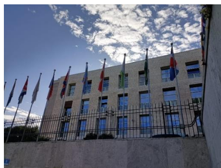
FAO Headquarters in Rome, where the kick-off meeting was held last September 2022

El pasado mes de septiembre se ha realizado la reunión del lanzamiento del proyecto B-THENET de 4 años de duración (de septiembre 2022 a agosto de 2026) en Roma, en la sede de la Organización de las Naciones Unidas para la Agricultura y la Alimentación (FAO), lugar donde los socios del proyecto presentaron sus competencias y sentaron las bases del trabajo.